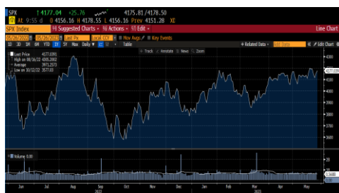
Índice S&P 500