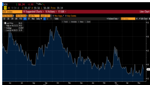
Índice de volatilidad VIX